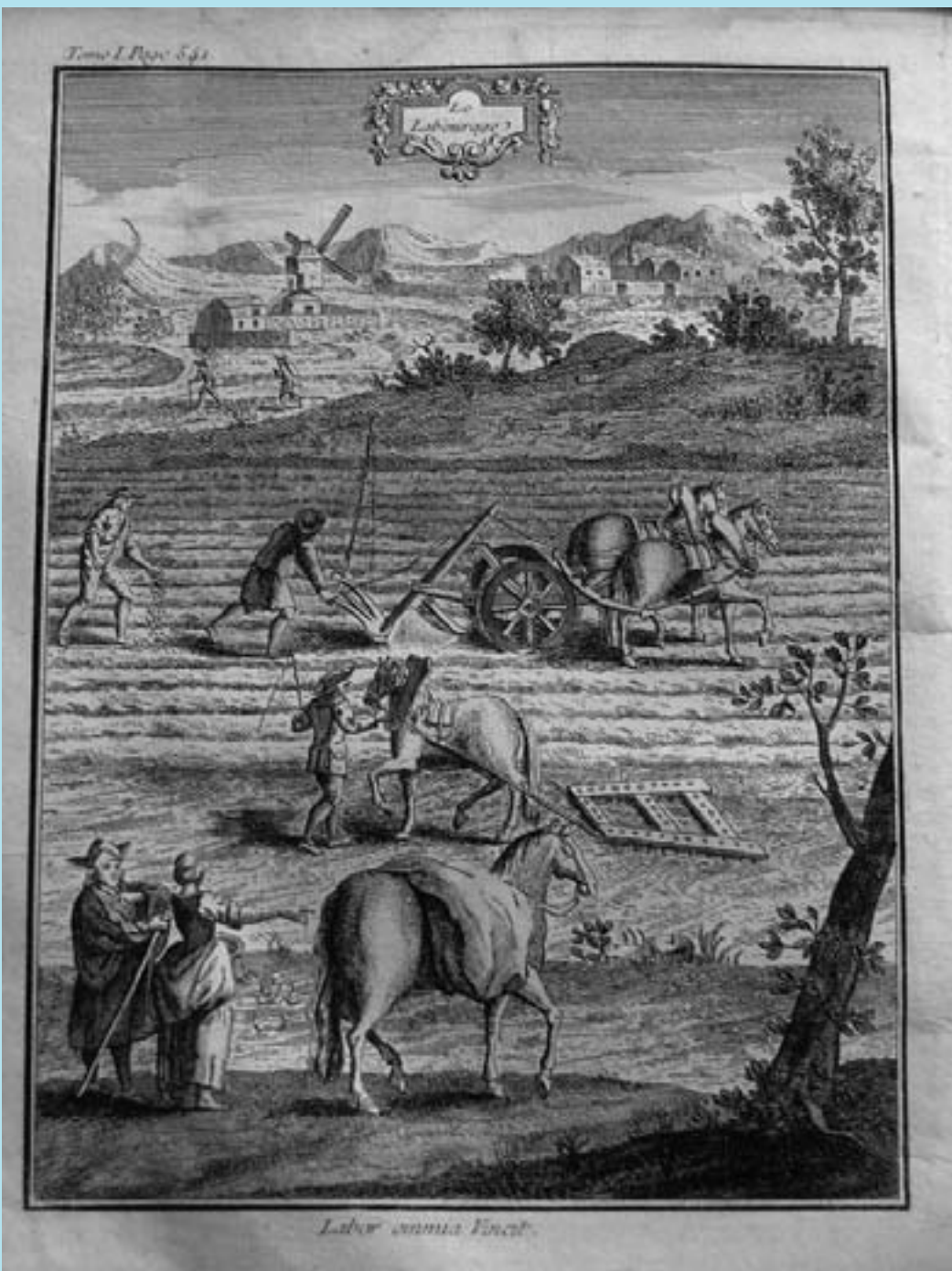
LE LABOURAGE "La maison rustique", édition de 1768

Le 18 janvier 1676, alors que Michel Guenot est curé de la paroisse, sont inhumés dans l'église, en présence de "Claude Chenery, maire dudit Chamoust et d'autres lieux, ainsi que Charles Chalumet, procureur fiscal, et Pierre, petit greffier de Sainte-Aulde, le cœur et les entrailles de messire Claude Baudoin, seigneur de Chamoust et d'autres lieux, décédé en son hostel seigneurial de Chamoust le 16 ; son corps ayant été conduit et inhumé à Paris dans la paroisse de saint Paul".