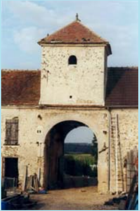
La ferme de la Porte ferrée à Sainte-Aulde

La création de l'État moderne établit définitivement la dépendance de la région avec la capitale, dont le développement imposait un accroissement continu des approvisionnements. Les résidences de campagne d'aristocrates se construisent, les terres sont achetées par les bourgeois et les nobles parisiens en vue d'un rendement financier et d'une promotion sociale. Dominique Séguier, évêque de Meaux (1637-1659), fils du chancelier, reprend en main des réseaux religieux, par le biais de la formation des prêtres, de synodes, de sanctions et de visites pastorales. Bossuet poursuit cette œuvre. On comprend que le retour des reliques de sainte Aulde se situe à cette époque.