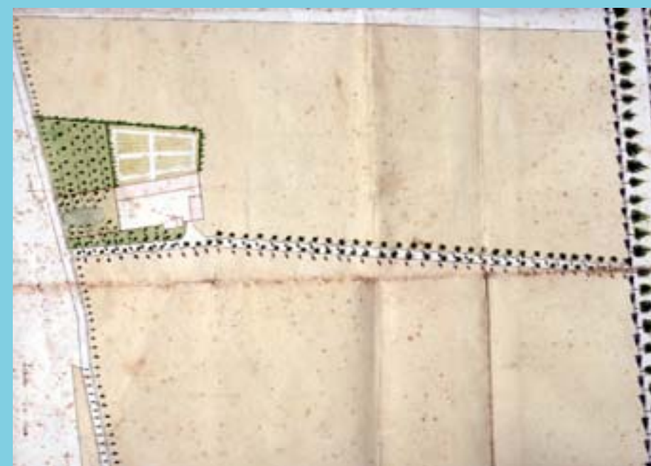
Plan de la ferme des Grands Davids

Un arpentage du "territoire de la paroisse de Sainte Aude - élections de Meaux -" est réalisé en 1787. On y retrouve les hameaux principaux de la commune, sous les orthographes suivantes : La Porte ferrée, la Bordette, Chamout, les Davids, Moitiébar, le Moncel, les Vernets, Caumont, et Pisseloup.